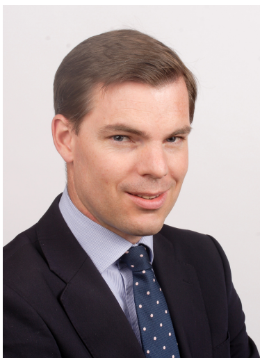
Augustin de Castet