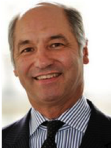
Guillaume Giscard d'Estaing